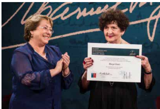
La presidenta de Chile, Michelle Bachelet, entrega el Premio Iberoamericano de Narrativa Manuel Rojas 2015 a la escritora mexicana Margo Glantz.

“Margo Glantz ha dicho que para ella la pregunta por el origen y la procedencia del discurso y su relación con el cuerpo, sobre todo con el cuerpo femenino, ha sido una verdadera obsesión, y ello lo podemos ver en la amplitud de sus intereses”, comentó.