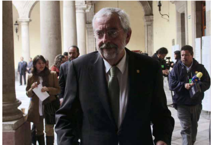
El rector de la UNAM, Enrique Graue Wiechers preside hoy su primera sesión de Consejo Universitario.

La máxima casa de estudios del país señaló que el objetivo de la carrera es que sus egresados puedan detectar situaciones y con su preparación incidan en la solución de problemas concretos, además de que sean capaces de impartir cátedra, entre otros ámbitos de acción.