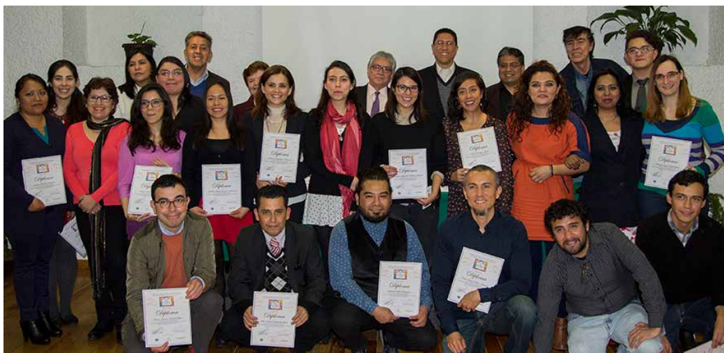
Generación XXVI de alumnos y maestros de la Beca Juan Grijalbo-CONACULTA.

“Creo que la capacitación dentro de la Cámara cumple una función fundamental. Y cada generación que egresa de esta beca nos llena de orgullo y satisfacción. Sobre todo porque quienes imparten el temario es gente con vasta experiencia, quienes